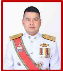
พล.ต.ต.อนุชา รมยะนันท์ รองผู้บัญชาการสำนักงานกำลังพล