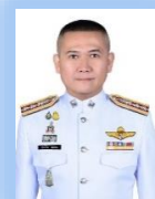
ว่าที่ พล.ต.อ.ณัฏวิศน์ อ่อนโยน ผกก.ฝ่ายประเมินบุคคล ทพ.