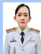
ว่าที่ พล.ต.อ.หญิง ลิบดาวรรณ เพชรสังหาร ผกก.ฝ่ายบรรจุ ทพ.