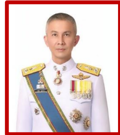
พล.ต.ต.ปริดา สภาว รองผู้บัญชาการสำนักงานกำลังพล