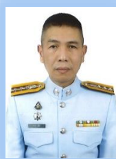
พล.ต.อ.ถาวร มีขำ รอง ผบก.ทพ.