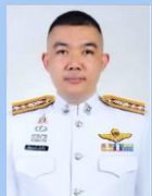
พล.ต.อ.พัฒนพงษ์ ภูมิเจริญ ผกก.ฝ่ายความชอบ ทพ.