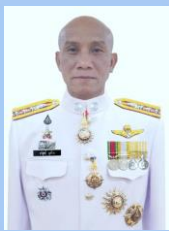
พล.ต.อ.บริสุทธิ์ นุศรีวอ รอง ผบก.ทพ.