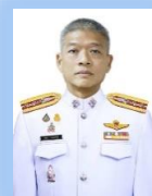
พล.ต.อ.นกตล กาญจนพันธุ์ ผกก.ฝอ.ทพ.